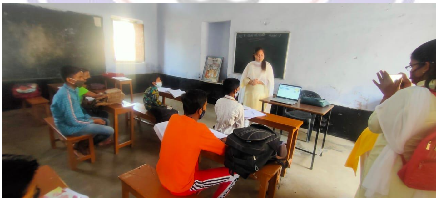
Aanandam : Sensitization of School Students for Energy conservation